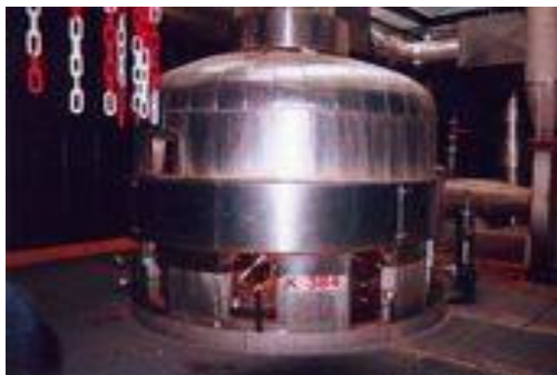
Réacteur DN 2 O chez Clariant S.A. : 3 millions de tonnes de CO 2 évités

L'IRMA a une première référence industrielle avec ce catalyseur depuis 10 ans chez Clariant S.A. sur une unité de synthèse de glyoxal. Cela se traduit en réduction des émissions de gaz à effet de serre par environ 3 millions de tonnes de CO 2 évités.