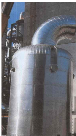
Réacteur de la nouvelle unité GPN d'acide nitrique où est installé le catalyseur de décomposition du N 2 O

Les performances de ce catalyseur sur l'abattement du N 2 O, qui se forme sur les toiles de platine suite à l'oxydation de NH 3 en NO, ont été présentés par GPN à la conférence ANNA à Little Rock aux USA en octobre 2009.